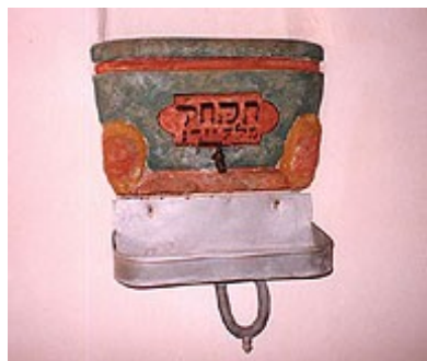
Fontaine pour l'ablution des mains