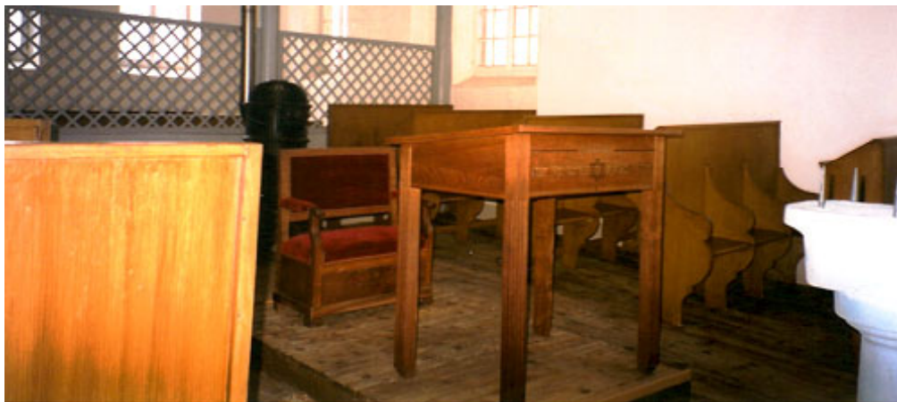
La synagogue a été entièrement restaurée en 1999, et elle est à présent ouverte en permanence au public.

Une des rares synagogues construites en Alsace sous l'Ancien Régime et qui soit encore conservée, est celle de Pfaffenhoffen, inaugurée en 1791. "À Pfaffenhoffen nous avons la dernière survivante d'une lignée : celle des synagogues faites pour permettre à un groupe de vivre son judaïsme" (Gilbert Weil - Les synagogues de Basse-Alsace , AMJAB, 1990). Elle est à la fois lieu de culte, centre communautaire, école, centre d'hébergement, four à "Matzoth" (pains azymes) pour la Pâque juive, et "Mikwe" (bain rituel). Elle est classée Monument historique et a bénéficié d'importants travaux de restauration.