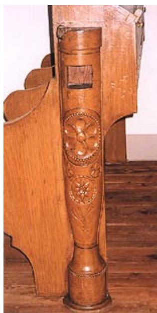
Tronc pour les aumônes